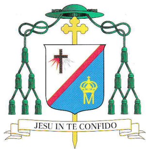
KAZIMIERZ GURDA BISKUP SIEDLECKI