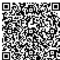
Kod QR Logo synodu

Słowo synod intuicyjnie kojarzy nam się ze zgromadzeniem biskupów. Chcąc lepiej zrozumieć to pojęcie trzeba sięgnąć do języka greckiego, z którego ono pochodzi. Greckie synodos dosłownie znaczy bowiem „chodzić razem” lub „być na wspólnej drodze” ( syn – razem, hodos – droga). W roku 2021, papież Franciszek zaprosił cały Kościół na Synod, którego tematem jest właśnie synodalność Kościoła. Pomocą w zrozumieniu tego pojęcia może być dla nas analiza logo trwającego synodu.