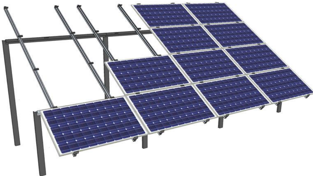
Rys. 1. Wizualizacja systemu montażowego oraz sposobu mocowania modułów fotowoltaicznych

Dla projektowanych modułów fotowoltaicznych proponuje się zastosowanie konstrukcji montażowej wolnostojącej na grunt (dwupodporowa, 4 rzędy poziomo):